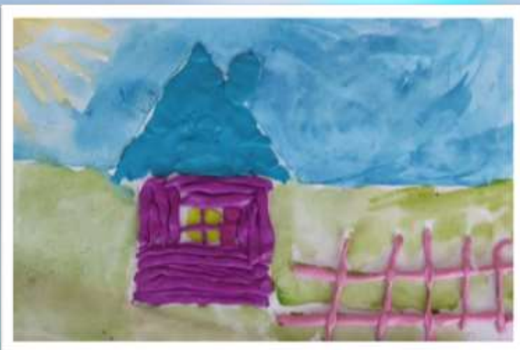
«Сказочный домик» Кобилова Рушана