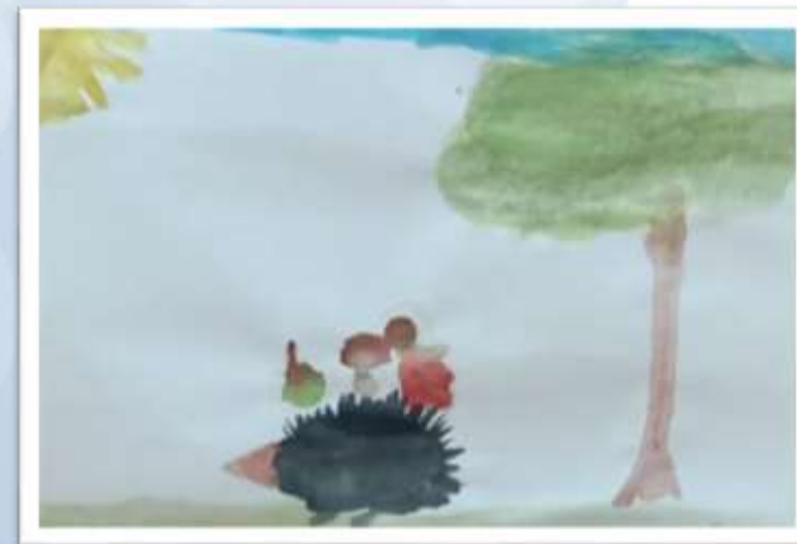
«Запасливый ёжик» Первухина Вика